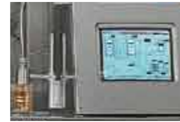
Test per la valutazione preventiva della TCC CCT assessment test Test für die Bewertung der kritischen Kristallisierungstemperatur Test para la evaluación preventiva de la TCC Test pour l'évaluation préalable de la TCC